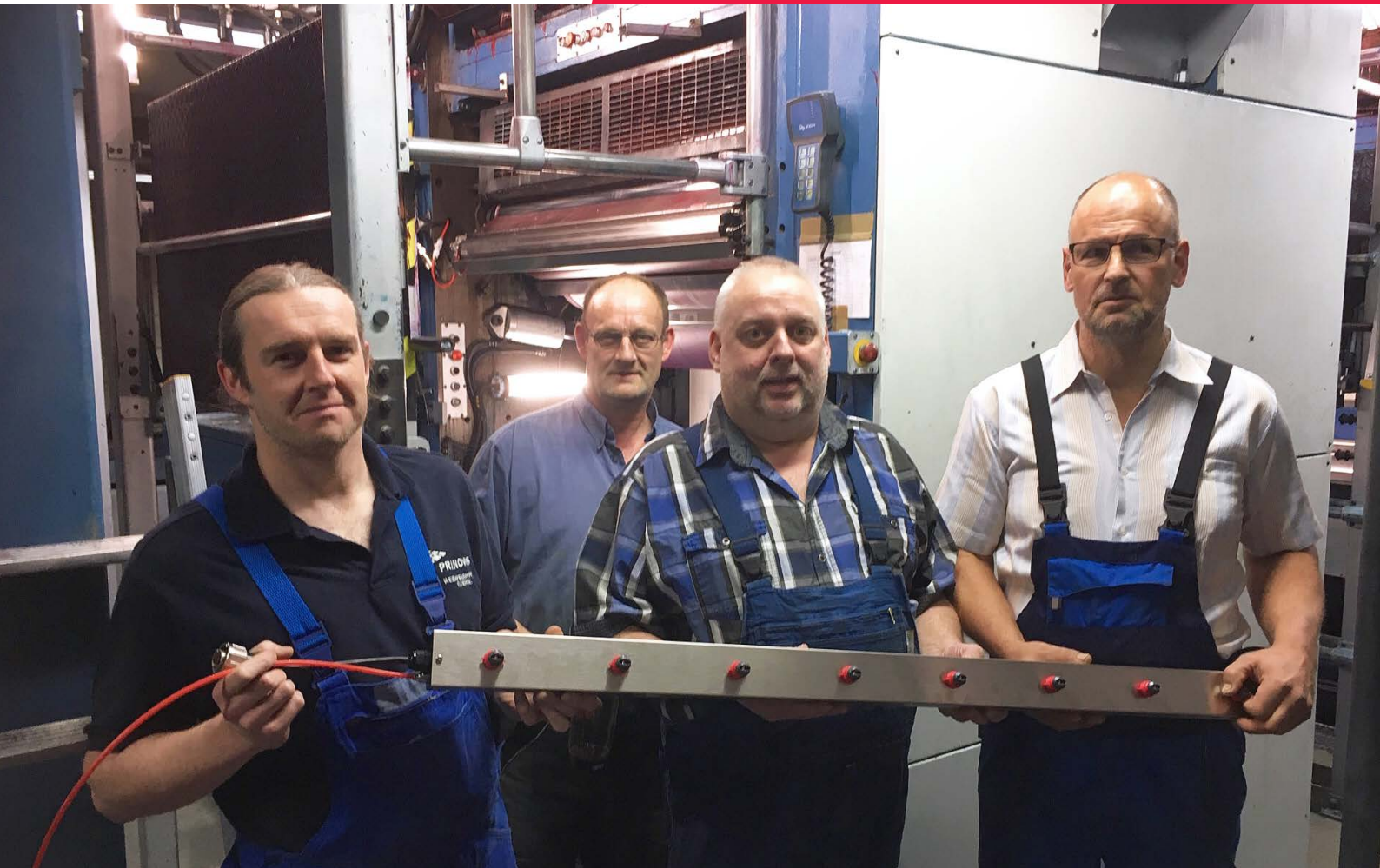
Das Produktionsteam der Boyens MediaPRINT GmbH, das einen EvenSpray World2 Sprühbalken hält.